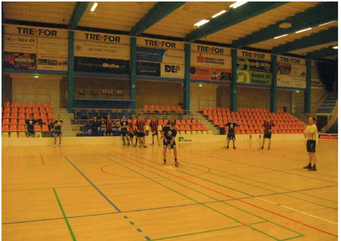
Spillerne på banen